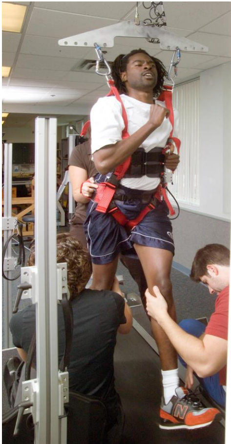
Entrenamiento locomotor en un centro NRN

Muchas de las intervenciones y tratamientos para la rehabilitación tiene muchos nombres que van desde la frase "tratamiento neurorehabilitador del movimiento" a más casuales como "tratamiento en cinta caminadora"; algunos son invasivos y otros no. Algunas de estas actividades ocurren en centros clínicos, mientras que otras pueden realizarse en la comunidad. Muchas conllevan movimiento o ejercicio. Lo que tienen en común es que son actividades o intervenciones empleadas para fines de rehabilitación. Todas proponen el regreso de la función, mejora de la salud y calidad de vida para las personas que viven con parálisis. El término "tratamiento" generalmente se utiliza sólo si la actividad está supervisada por profesionales de la salud que pueden incluir fisioterapeutas o terapeutas ocupacionales. El término "intervención" es el término más común cuando la actividad no está siendo supervisado por los profesionales de la salud.